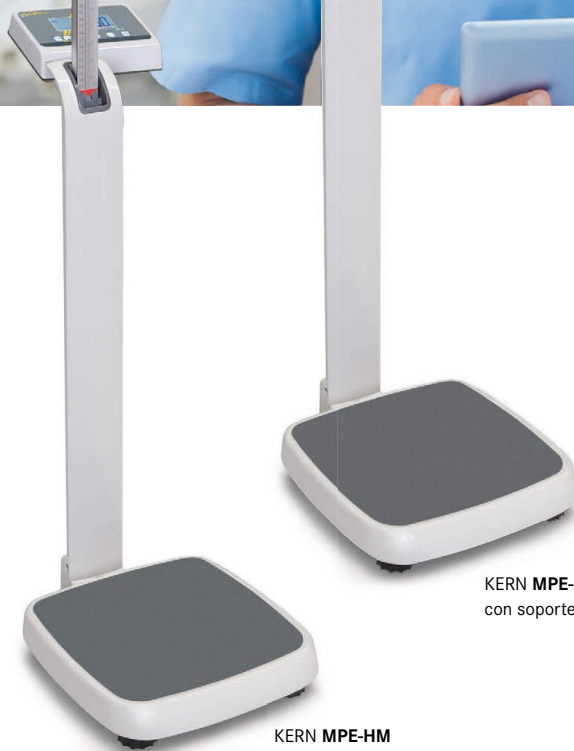
KERN MPE-PM con soporte